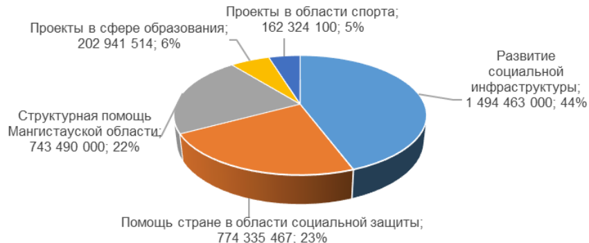
Структура проектов Фонда "Халык" в 2023 году